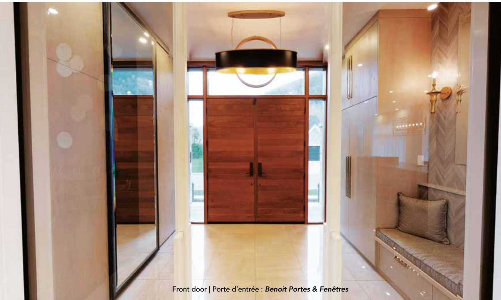
Front door | Porte d'entrée : Benoit Portes & Fenêtres